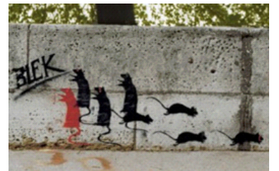
BLEK LE RAT

Le street art né dans la rue devient une des composantes majeures de l'art contemporain .